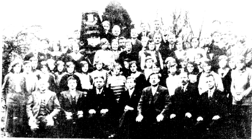
Zangvereniging „De Liederentafel”

Eveneens in 1931 vindt een tweede belangrijke gebeurtenis plaats in de geschiedenis van het koor. Het mannenkoor wordt een gemengd koor. Waarschijnlijk is de oproep in september 1931 bedoeld om dames op te roepen om lid te worden van het koor. De naam verandert in “Gemengde Zangvereniging